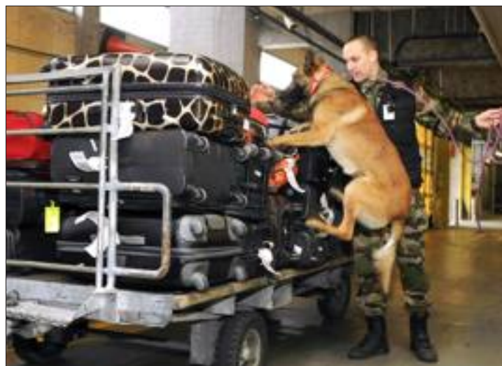
Des chiens sont amenés à rechercher d'éventuels explosifs et stupéfiants dans les bagages.

Peu connus, les gendarmes des transports aériens sont un maillon essentiel dans la sûreté des airs mais aussi des sites aéronautiques. Une brigade de 19 personnes est chargée de l'EuroAirport mais aussi du sud du Haut-Rhin, des régions Bourgogne et Franche-Comté. Avec trois missions principales : la sûreté des installations aéronautiques, notamment en matière réglementaire ; la police judiciaire, particulièrement en cas d'incidents, voire d'accidents ; le recueil d'informations d'ordre aéronautique.