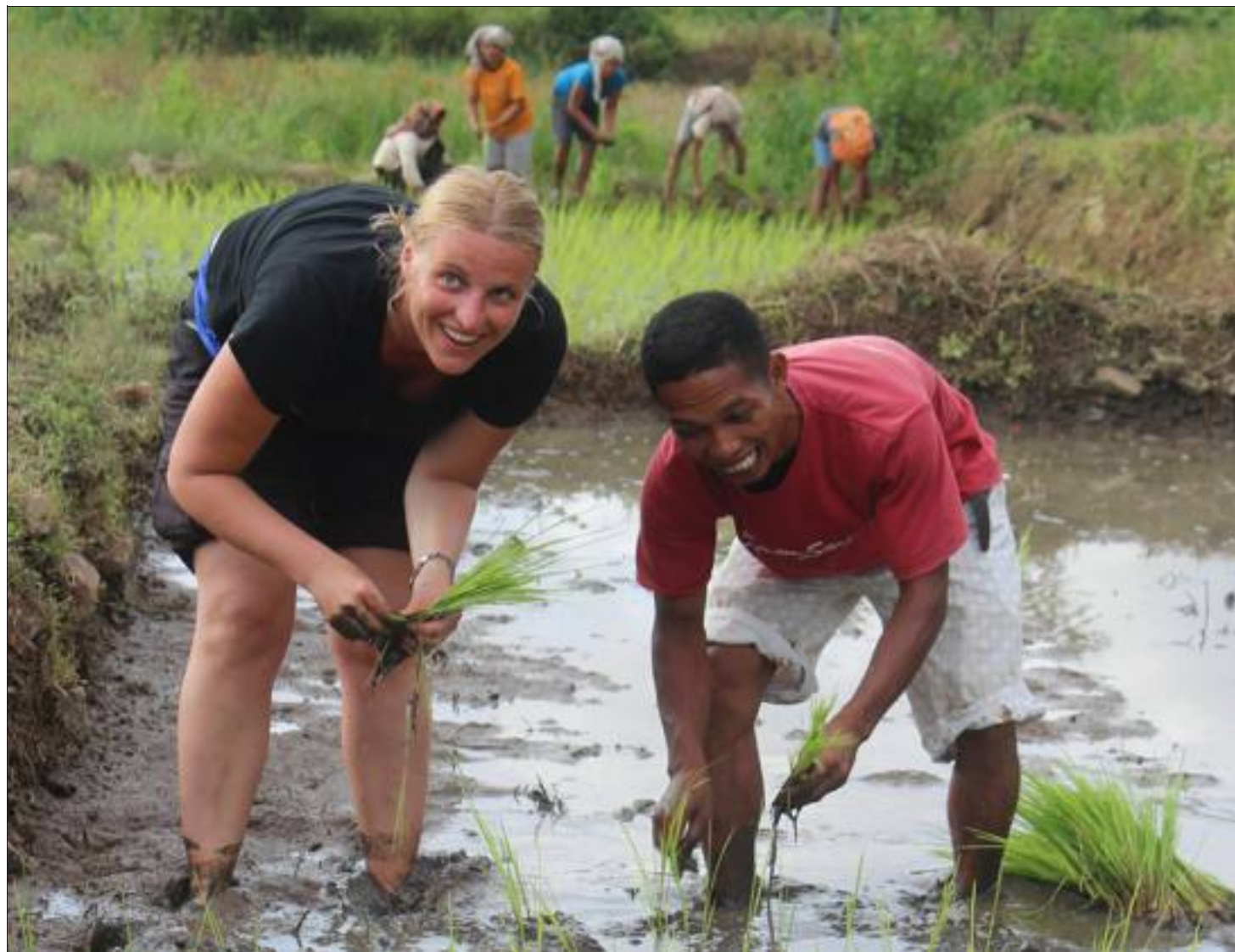
Initiation à la cueillette du riz, au hasard d'un chemin et d'un simple sourire échangé...